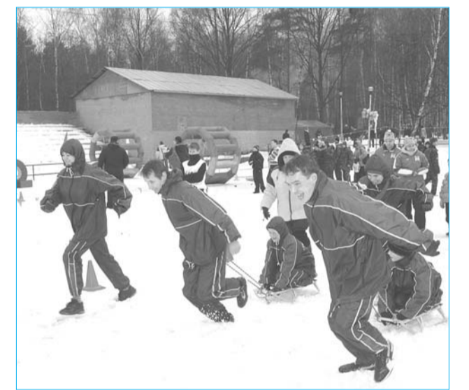
Поздравляем будущих защитников Родины с заслуженной победой! Так держать!