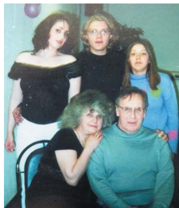
1983 год - вся семья вместе