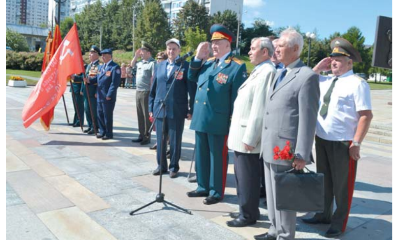
Митинг в честь отражения первого налета на Москву