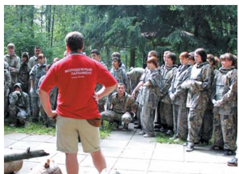
Событие было зрелищным и останется в памяти участников и зрителей надолго.

Бойцы вспомнили героев легендарной битвы и познакомились с построением и экипировкой русских войск в 1812 году.