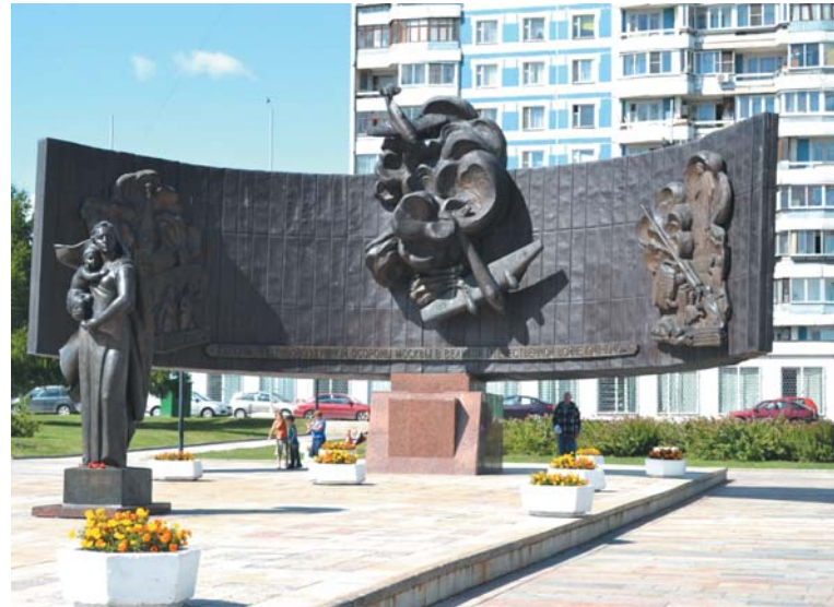
Памятник героям противовоздушной обороны